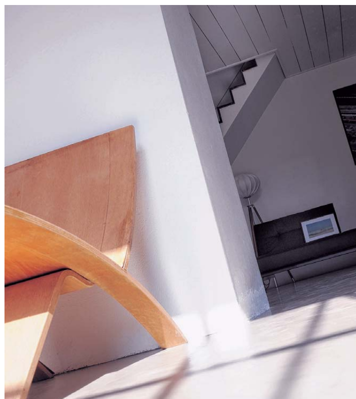
Une ligne de revêtements à découvrir.