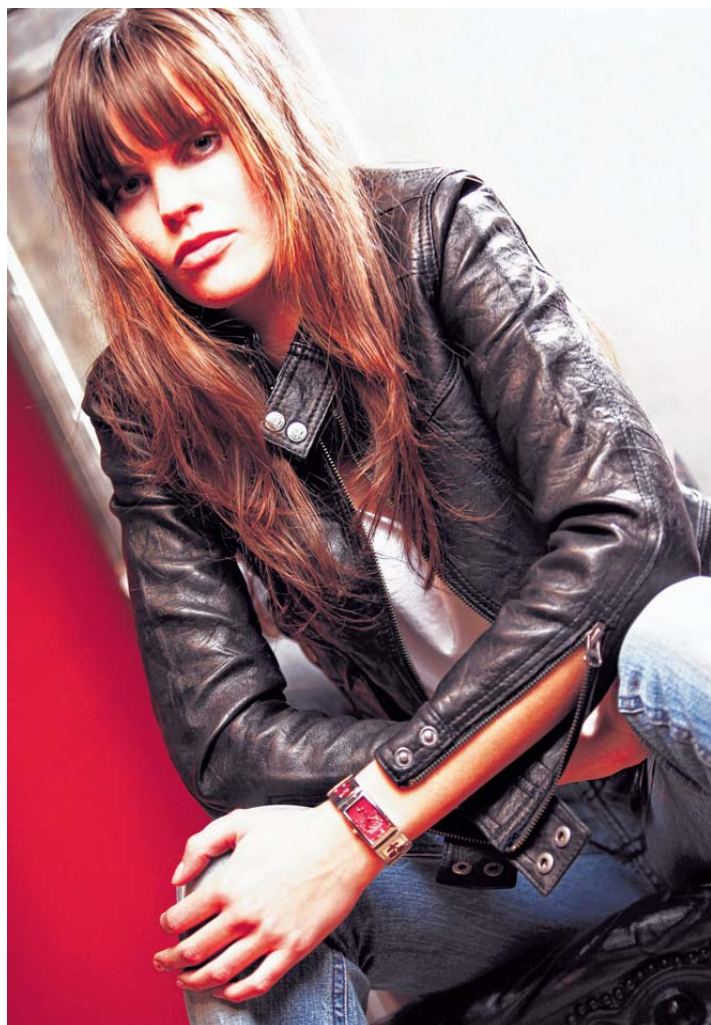
La marque de jeans made in Marseille développe sa collection accessoires.

Plus besoin de vous présenter la marque aux jeans qui mettent si